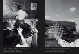
Aula com Josef Albers (B) Black Mountain College.

Os principais artistas, responsáveis pela vanguarda artística americana, foram alunos do Black Mountain College, como: Josef e Anni Albers, John Cage, Buckminster Fuller, Merce Cunningham, entre outros.